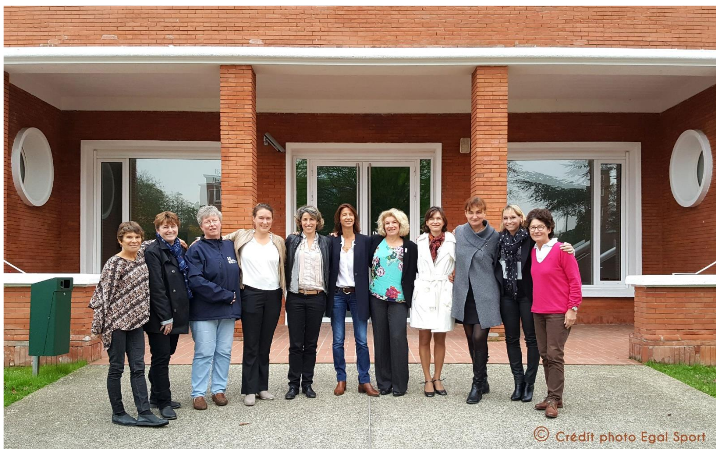
Réunion des DTN à l'INSEP 26 Octobre 2017 (légende Page 3)

Créé au début des années 60, à la suite de l'échec du sport français aux Jeux Olympiques de Rome, le poste de « directeur technique national » (DTN) d'une fédération sportive a été plus que majoritairement occupé par des hommes.